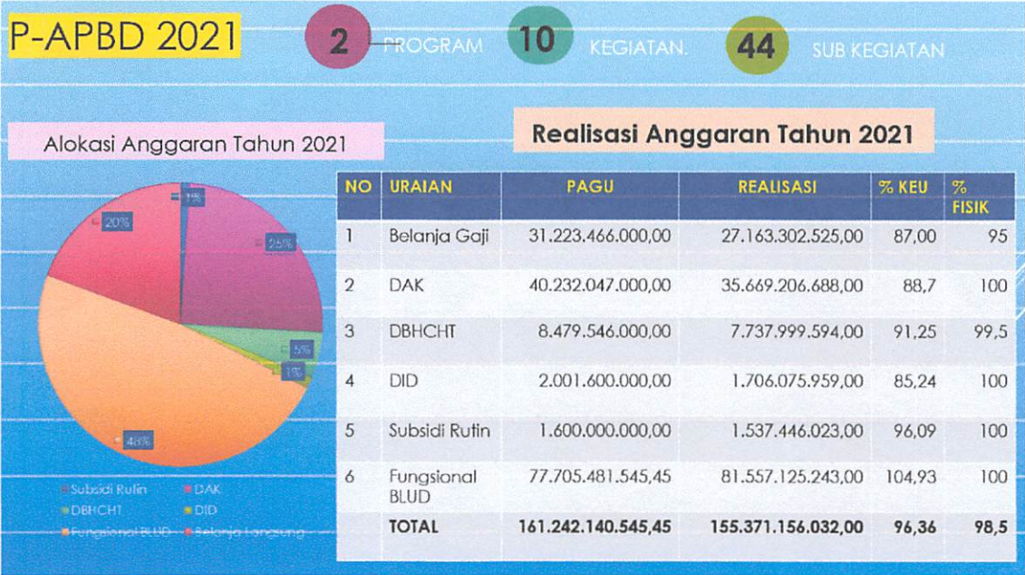
Gambar 2. Realisasi Anggaran RSUD Karsa Husada Batu Tahun 2021

Total ASN RSUD Karsa Husada Batu sebanyak 206 orang, sedangkan capaian untuk IP ASN berdasarkan hasil rekapitulasi di e-master sebesar 80,67 dengan rincian sebagai berikut: